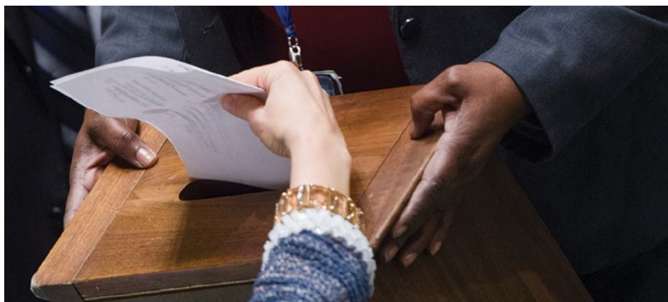
UN PHOTO/AMANDA VOISARD